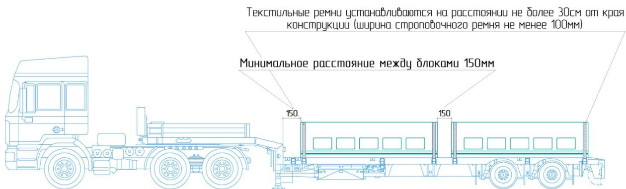
Схема фиксирования бетонных блоков на автотранспорте